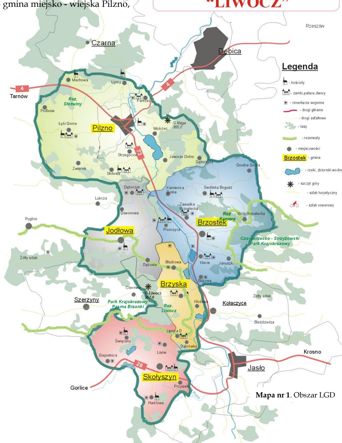
Mapa nr 1. Obszar LGD